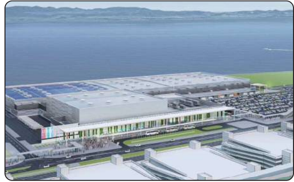
愛知県国際展示場の建設（空港島）