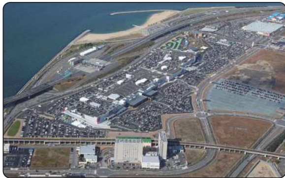
開発が進む空港対岸部（常滑市）