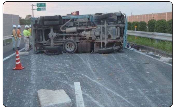
知多半島道路の交通事故状況