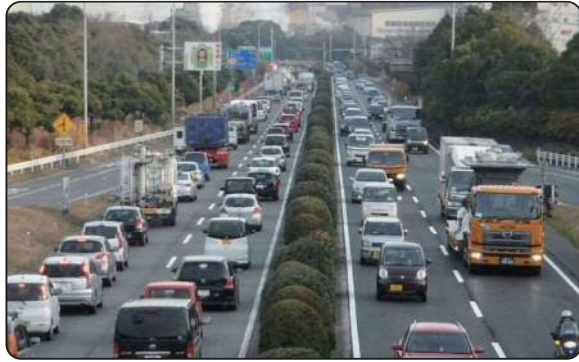
国道 247 号の渋滞状況（東海市）