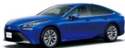
トヨタ自動車豊田市元町工場