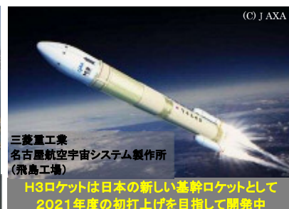
三菱重工業 名古屋航空宇宙システム製作所 (飛鳥工場)

H3ロケットは日本の新しい基幹ロケットとして 2021年度の初打上げを目指して開発中