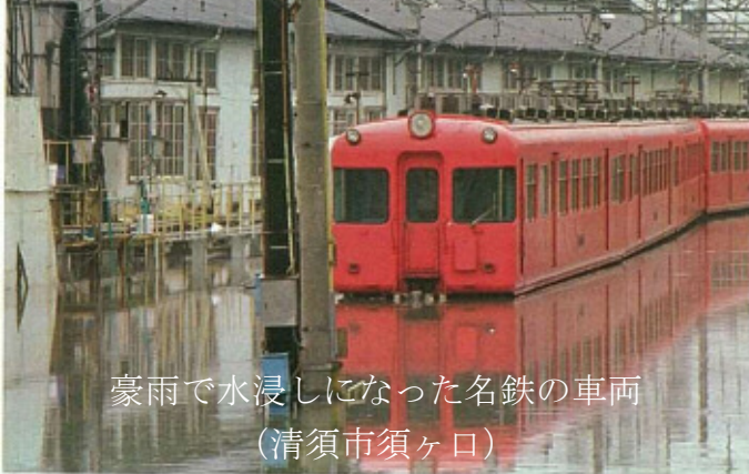
鉄道がストップ。通勤に大きな影響が発生