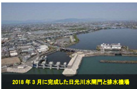
2018年3月に完成した日光川水閘門と排水機場