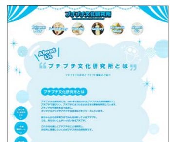
▲ プチプチ文化研究所 杉山さんが所長を務めるプチプチ®に関する研究所(設立:2001年)。記念日(8月8日)の制定やオリジナルグッズなど遊び心を持ちながらプチプチ文化の収集・発信・研究している。 http://www.putiputi.co.jp/putilabo/