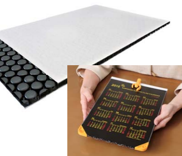
▲ プラパール® 真空形成されたキャップとよばれる円柱成形シートを上下からシートで挟んだプラスチックボード。画像は、社員全員に配られる社内カレンダー付きカレンダー(非売品)。