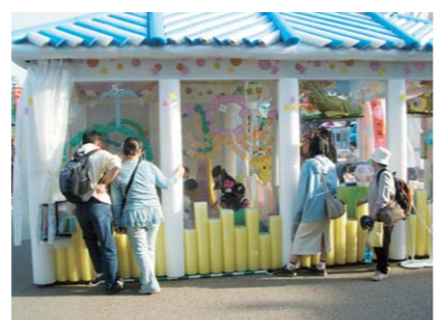
▲ プチプチ®ハウス 2005年愛知万博の名古屋商工会議所のパビリオンで、屋外にプチプチ®製の家を展示し、注目を集めました。