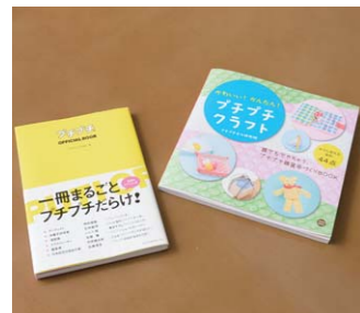
▲ プチプチ®本 プチプチ®文化を広めるべく、「プチプチ®オフィシャルブック」(2006年)、「プチプチ®クラフト」(2014年)を刊行。