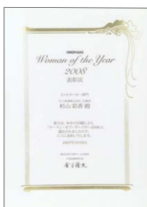
▲ 「ウーマン・オブ・ザ・イヤー」受賞 それまでの活躍が認められ、2008年に日経ウーマン「ウーマン・オブ・ザ・イヤー」を受賞。