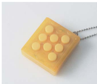
▲ ∞(むげん)プチプチ® 2007年(株)バンダイと共同で開発した「∞(むげん)プチプチ®」。つぶし続ける感覚を永久に楽しめることで話題となり、累計300万個を超える大ヒット商品に。