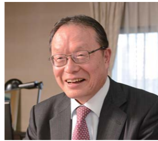
▲ 「人のやらないことをやらない、新しいことにチャレンジし、人の役に立つことをやり続けられれば、すごく楽しい人生になる」と社員に語る、丹羽社長。