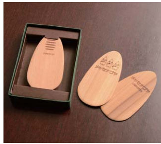
▲ 靴べら「シューホン」 木材の強度を活かしながら柔らかくする技術により生まれた第1号の商品であり、ノベルティグッズとして好評。メッセナゴヤの記念品としても使わせていただきました。