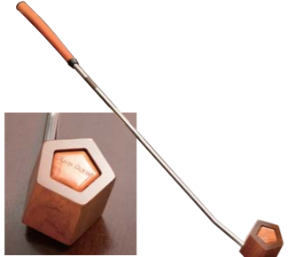
▲ ペンタプター・ウッドイー 特許技術を使い国産のヒノキを圧縮した木材と正五角形の特徴を活かし、どこにあってもスイートスポットとなるパター。ゴルフの聖地、英国セントアンドリュースのショップでも実際に販売されています。