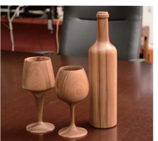
▲ 写真は商品化されたものではありませんが、木製のサンプルとして作成されたもの。実際の商品や木製のサンプルがあることにより、様々なアイデアが出てくるのは、とても不思議です。