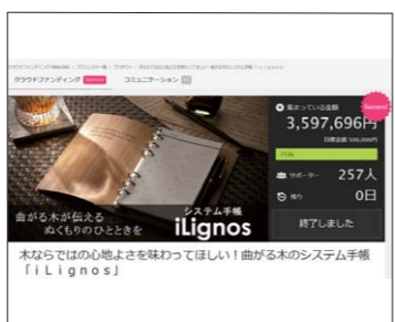
▲ 新しく開発した商品に対する評価をインターネット上で確認するためクラウドファンディングにも挑戦。曲がる木のシステム手帳「iLignos (アイリグノス)」(右商品)は、機能性とともにも木ならではの温かみが評価されました。