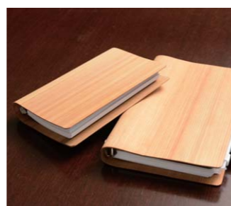
▲ 曲がる木のシステム手帳「iLignos (アイリグノス)」木材圧縮技術によって驚くほどの柔軟性が加えられたシステム手帳。木ならではの心地よさを追求した商品で、ビジネスの現場に温もりを与えるツールとして好評です。