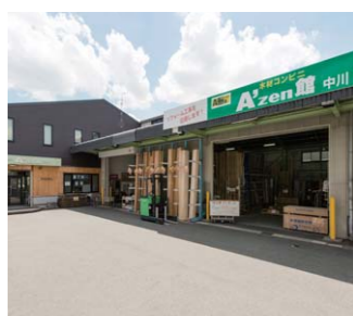
▲ 木材コンビニ「A'zen (エイゼン) 館 中川」木材のプロショップとしてリフォームや個人のDIY需要の増加にも対応。高品質な木材、最新の住宅設備機器にいたるまで、ホームセンターにはない豊富な品揃えがあります。

これからの様々なアイデアを実現することで、木の魅力や素晴らしさを世の中に広めていく挑戦を続けていきたいと考えています。